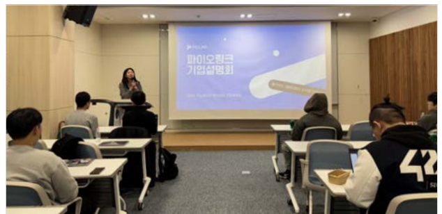
<11월 28일, 파이오링크가 참여한 제7회 기업방문 설명회 현장>