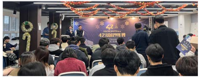
<12월 12일, 42서울인의 밤 진행 현장>