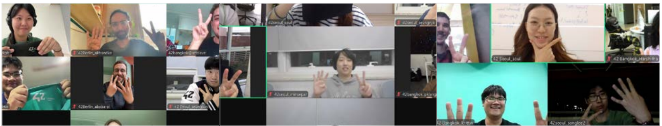
<10월 28일부터 30일까지 진행된 42서울 글로벌 이벤트 진행 화면 (좌측부터 미니해커톤, 글로벌 동료평가, 라디오쇼)>