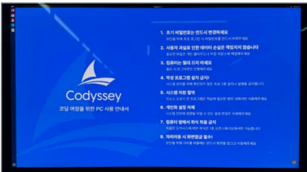
<코디세이 PC 사용안내서>

이노베이션아카데미(학장 전영표)의 혁신 소프트웨어 교육 플랫폼인 Codyyssey(코디세이)를 서울경제진흥원(대표 김현우)에서도 경험할 수 있게 됩니다. 오는 12월 2일부터 서울경제진흥원에서 진행되는 청년취업사관학교(SeSAC POST)에 코디세이를 활용할 예정입니다. SeSAC POST 과정은 이노베이션아카데미의 3無(강사, 교재, 학비) 교육 철학을 바탕으로 새싹과 42서울 학습자간의 동료학습 및 자기 주도학습이 가능한 혁신 교육 프로그램 코디세이를 도입한 학습 과정입니다. 이번 새싹 포스트 과정에서 경험할 수 있는 코디세이는 AI학습 콘텐츠를 활용하여 SW 인재를 양성할 예정입니다.