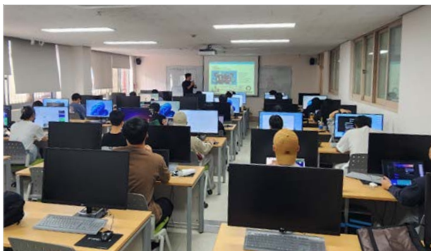
<우송대학교 코디세이 진행 현장>

이노베이션아카데미(학장 전영표)와 우송대학교(총장 오덕성)는 지난 9월 23일부터 우송대학교 SW중심대학사업단에서 이노베이션아카데미의 혁신 소프트웨어 교육 플랫폼인 Codyssey(코디세이)를 활용한 비교과 프로그램 운영에 들어갔다고 9월 30일 밝혔습니다.