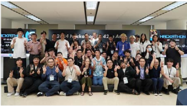
<제1회 42 아시아 연합 해커톤대회 사진>

지난 9월 23일부터 27일까지, 이노베이션아카데미에서 42서울과 42 Singapore가 공동 주최한 ‘제1회 42 아시아 연합 해커톤 대회’가 진행되었습니다. 올해 처음 개최된 연합 해커톤 대회는 대회 공동 주최사인 42서울과 42 Singapore와 더불어 42 Tokyo, 42 Bangkok, 42 KL(쿠알라룸푸르), 42 Anman 등 총 6개의 아시아 캠퍼스가 참여했습니다.