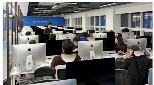
<서울경제진흥원 하반기 코디세이 현장>

AI분야에 관심 있는 42서울 심화과정 교육생과 SeSAC 수료자가 참여하는 서울경제진흥원 코디세이는 약 3개월의 과정을 거쳐 SW 인재로 거듭날 예정입니다.