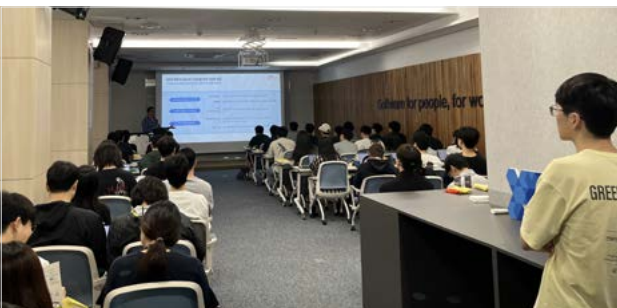
<9월 12일, SK C&C가 참여한 제6회 기업방문 설명회 현장>