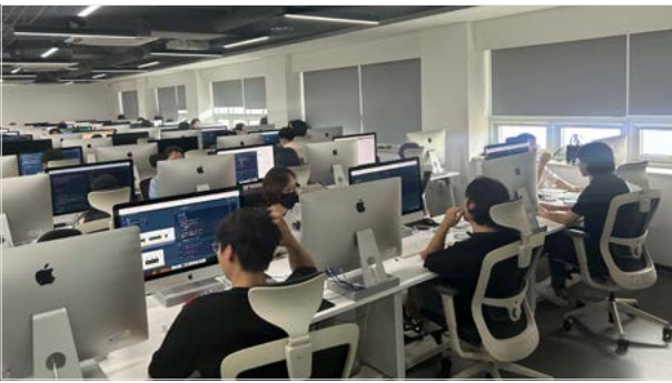
<하반기 PCCP 시험 현장>

2023년에 이어 2024년에도 42서울의 교육 우수성을 입증하고, 공정한 SW역량 평가를 위해 이노베이션아카데미는 공공주관, 민간주관의 두 가지 SW 역량 평가 방식을 도입했습니다.