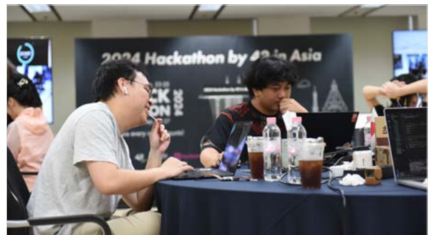
<42 아시아 연합 해커톤 진행 현장>

이외에도 광화문 투어, 청와대 투어 등 다양한 투어 행사까지 진행하여 국적을 초월한 우정을 다졌습니다. 이번 제1회 42 아시아 연합 해커톤 대회는 각 캠퍼스 간의 협력을 강화하고 글로벌 협업 진행으로 교육생들에게 뜻 깊은 경험을 선사하는 시간이었습니다.