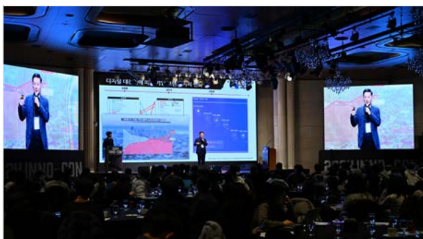
<이노베이션아카데미 전영표 학장이 발표 중인 INNO-CON 현장>

지난 12월 4일 서울 엘타워에서 개최된 ‘2024 INNO-CON’이 성황리에 마무리되었습니다. 가상현실(VR) 드로잉 퍼포먼스로 막을 연 이 날 행사에는 250여 명의 교육생과 기업·기관 관계자가 모였습니다. 이어 42서울에서 교육 참여도와 성과가 뛰어난 교육생들, 재단이 주관한 학업 성취도 향상 부트캠프에서 우수한 성과를 거둔 팀들이 시상대에 올랐습니다.