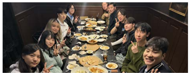
<11월 6일 매드포갈릭 도곡점에서 진행된 42서울 3기 앰배서더 '사이사이' 해단식 현장>