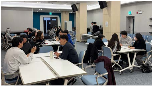
<서울경제진흥원 하반기 코디세이 현장>

이노베이션아카데미(학장 전영표)의 혁신 소프트웨어 교육 플랫폼인 Codyyssey(코디세이)를 서울경제진흥원(대표 김현우)에서도 경험할 수 있게 됩니다. 오는 12월 2일부터 서울경제진흥원에서 진행되는 청년취업사관학교(SeSAC POST)에 코디세이를 활용할 예정입니다. SeSAC POST 과정은 이노베이션아카데미의 3無(강사, 교재, 학비) 교육 철학을 바탕으로 새싹과 42서울 학습자간의 동료학습 및 자기 주도학습이 가능한 혁신 교육 프로그램 코디세이를 도입한 학습 과정입니다. 이번 새싹 포스트 과정에서 경험할 수 있는 코디세이는 AI학습 콘텐츠를 활용하여 SW 인재를 양성할 예정입니다.