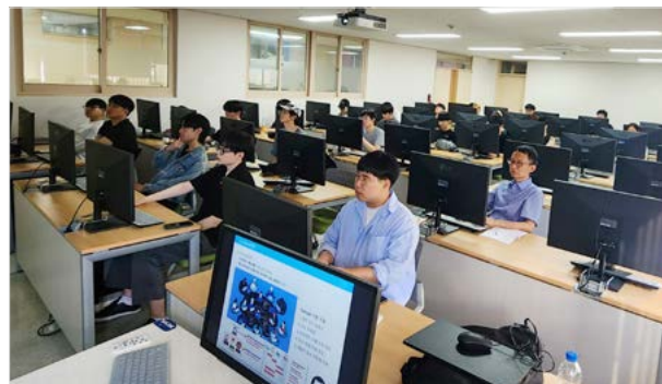
<우송대학교 코디세이를 열심히 듣는 학생들>

이노베이션아카데미는 과학기술정보통신부와 정보통신기획평가원의 지원을 받아 설립된 SW교육기관으로 혁신적인 소프트웨어 교육 프로그램을 기반으로 산업 수요에 맞는 소프트웨어 인재를 양성하고 있습니다. 올해부터는 ‘Project-X’의 명칭을 ‘코디세이’로 변경해 본격적인 프로그램 운영에 박차를 가하고 있습니다.