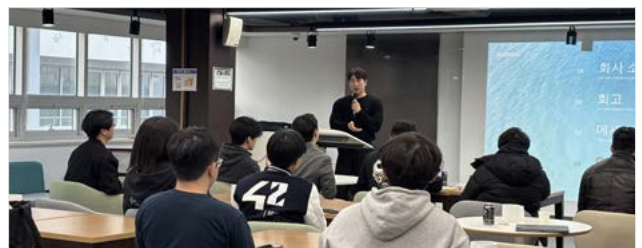
<12월 9일, 제2회 창업 역량 교육 현장>