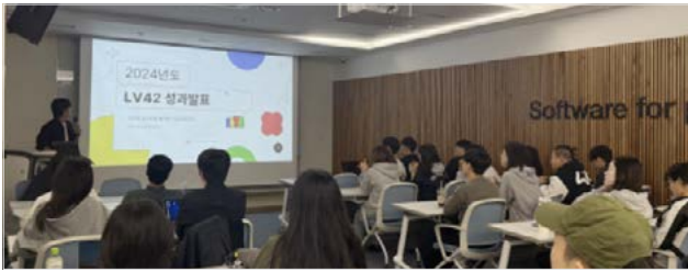
<10월 28일, 42서울 내 7개 동아리가 참여한 42서울 동아리성과발표회 현장>